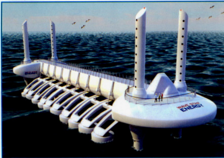
Grafik med Wave Star med 2x10 flydere.

Danmarks forbrug. En diskussion, der føres vildt og inderligt.